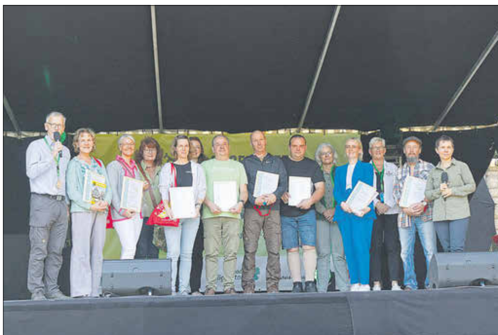
9 Betriebe und Institutionen erhielten ihre Auszeichnung als Naturpark-Partner im Rahmen des 122. Deutschen Wandertages in Heilbad Heiligenstadt.