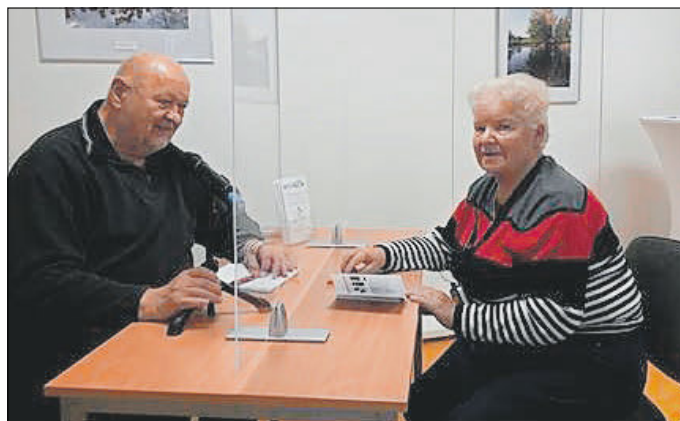
Beratungsgespräch 2022, Haus des Miteinander Hörens im DSB Ortsverein Weimar e. V.