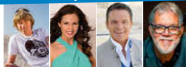
Mickie Krause, Anita Hofmann, Stefan Mross und Wolfgang Trepper