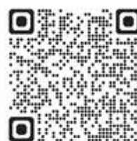
FACEBOOK STADT BAD LANGENSALZA