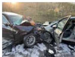
Das Team der Feuerwehr Bad Langensalza