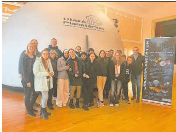
Besuch vom Förderverein und Bürgermeister bei der Vorstellung des Wanderplanetariums