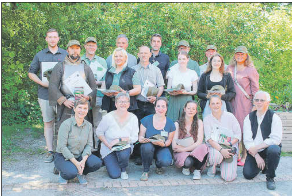
15 neue Natur- und Landschaftsführer erhielten ihre Auszeichnungen und sind nun als Botschafter für den Naturpark unterwegs.

Weitere Informationen finden Interessierte auf der Webseite www.naturpark-ehw.de . Die Naturparkverwaltung steht Kommunen und Einwohnern als Ansprechpartner zur Verfügung.