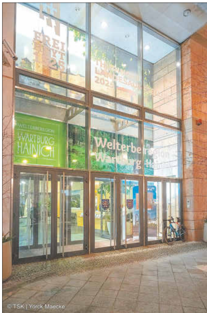
Landesvertretung des Freistaats Thüringen in Berlin

Der Festakt wurde vom Welterberregion Wartburg Hainich e.V. organisiert, welcher kreis- und regionsübergreifend mit dem Ziel der kooperativen und koordinierten Regional- bzw. Tourismusedwicklung in der gleichnamigen Region arbeitet. In der Mitte Deutschlands gelegen, bietet die Welterberregion Wartburg Hainich eine einzigartige Nähe von weltbedeutender Kultur umgeben von abwechslungsreicher Natur im Nationalpark Hainich und dem Naturpark Eichsfeld-Hainich-Werratal. Die Wartburg in Eisenach zählt als erste Burg Deutschlands zum UNESCO-Weltkulturerbe und gilt als ein bedeutendes Symbol deutscher Geschichte. Auch der urwüchsige Nationalpark Hainich - in Teilen UNESCO-Weltnaturerbe - ist nur einen (Wild-)Katzensprung von der Wartburgstadt Eisenach, der Kur- und Rosenstadt Bad Langensalza und der Mittelalterlichen Reichsstadt Mühlhausen mit ihren historischen Fachwerk-Altstädten sowie der barocken Residenzstadt Gotha mit dem UNESCO-Weltdokumentenerbe im Schloss Friedenstein entfernt, welche jährlich zahlreiche Besucherinnen und Besucher anziehen.