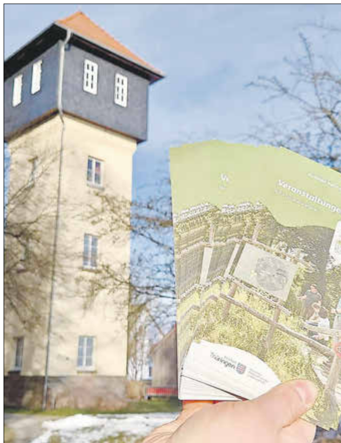
Die handliche Faltkarte mit QR-Code führt zu über 200 Veranstaltungen im digitalen Naturparkprogramm 2025.