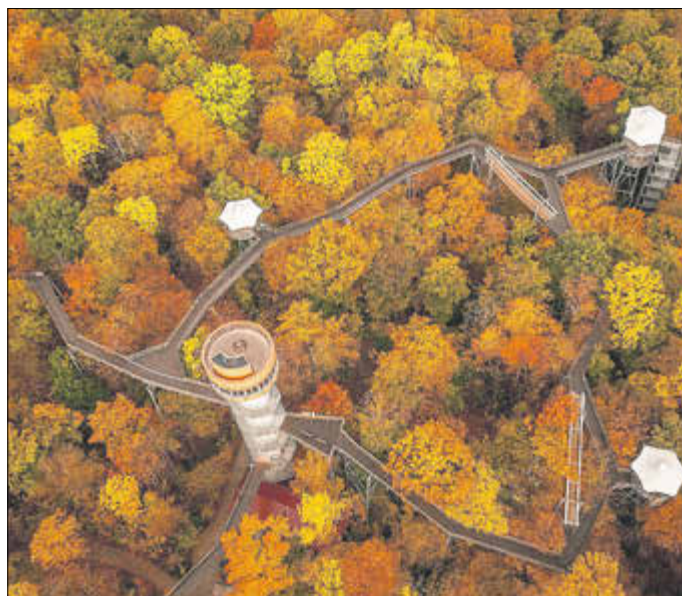
Die herbstliche Farbenpracht des Nationalparks Hainich lässt sich vom Baumkronenpfad aus am besten bestaunen.

Der Baumkronenpfad bietet allen Besuchern eine Bonuskarte an. Das Kassenteam stempelt die Karte bei jedem Besuch ab. Der fünfte Ausflug zum Baumkronenpfad ist kostenfrei. Die Bonuskarte gilt bis zum 31. Dezember 2025.