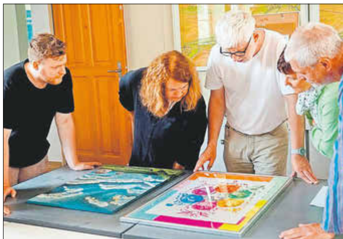
Die Arbeit der Jury

Des Weiteren werden 58, von regionalen Kultur- und Tourismuseinrichtungen gesponserten, Sonderpreise vergeben. Und damit auch danach noch alle Interessierten die Chance haben, der jungen Kunst Nordthüringens zu begegnen, bleibt die Ausstellung bis zum 24. Oktober (Fr-So, 13-17 Uhr) geöffnet.