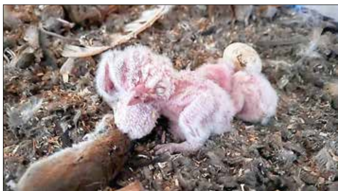
Ein Erlebnis der besonderen Art: Die Erwachsenen und die Kinder konnten auch direkten Kontakt mit den jungen Schleiereulen aufnehmen.