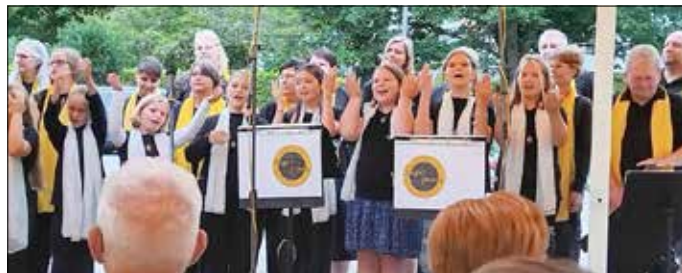
Chor im Schösschenpark LSZ

Ein Abschluss mit Herz ist besonders wichtig: Mit einem Teil der Spenden dieses Wochenendes wird das Hospiz Evelyn in Mühlhausen unterstützt. Mit diesem Beitrag möchte der Chor Dankbarkeit zurückgeben und dort unterstützen, wo Hilfe gebraucht wird. Zwei Auftritte, zwei besondere Orte, unzählige Gänsehautmomente - die Gospelfriends sagen Danke für offene Türen, offene Ohren und offene Herzen.