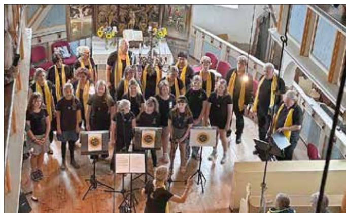
Auftritt in Zimmern