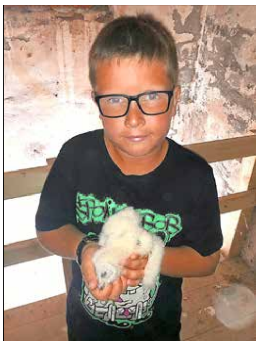
Eine junge gerade geschlüpfte Schleiereule.