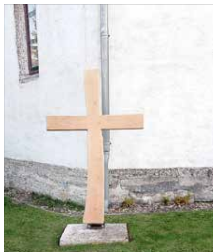
Die Stele in Form eines Kreuzes soll an Verstorbene erinnern.

Eine Stele aus feinstem Robinienholz in Form eines Kreuzes wurde jetzt (19.08.) auf dem Friedhof in Grumbach - einem Ortsteil von Bad Langensalza - aufgestellt. Damit wurde der vor einem Jahr gefasste Beschluss des Gemeindegemeinderates umgesetzt. Dieses Kreuz ist ein Denkmal, das die Namen der Verstorbenen trägt, die unter dem „grünen Rasen“ beigesetzt werden. Mit dieser Stele bleibt die Erinnerung an die geliebten Menschen für jeden sichtbar erhalten. Auf einer Natursteinplatte aus Muschelkalk kann Blumenschmuck im Andenken an die verstorbenen Angehörigen abgestellt werden. Der Gemeindegemeinderat bedankt sich auf diesem Wege auch im Namen von Pfarrer Hansjürgen Dehne bei dem gelernten Zimmermann Daniel Betker, der dieses Kunstwerk hergestellt hat. Dank gilt nicht zuletzt den Firmen Ascharaer Landwirtschaftsgesellschaft mbH und der TMP Fenster + Türen GmbH, welche das Projekt finanziell und tatkräftig unterstützt haben.